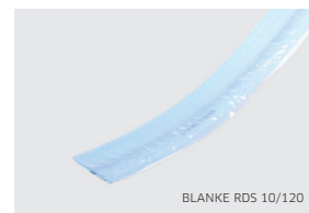
BLANKE RDS 10/120

BLANKE PERMATOP BF und BFC lassen sich optimal mit BLANKE PERMATOP WALL (Seite 76) und BLANKE BASEMAX (Seite 64) kombinieren.