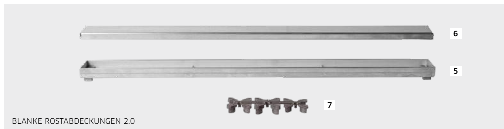
BLANKE ROSTABDECKUNGEN 2.0