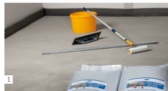
1 Préparer les instruments et les matériaux