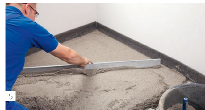
5 Compacter et enlever