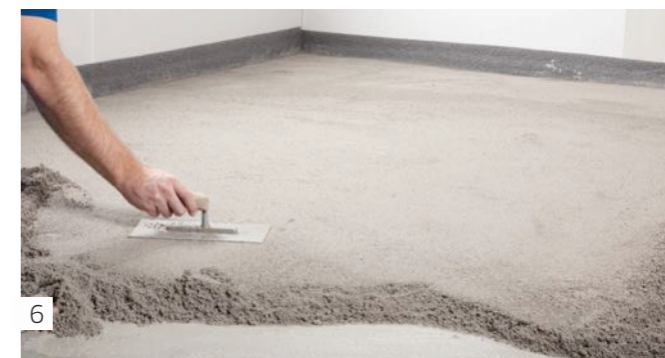
6 Lisser. Peut être recouvert après 12 heures