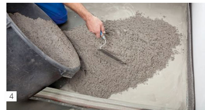
4 Répartir BLANKE BASEMAX délayé mouillé sur mouillé