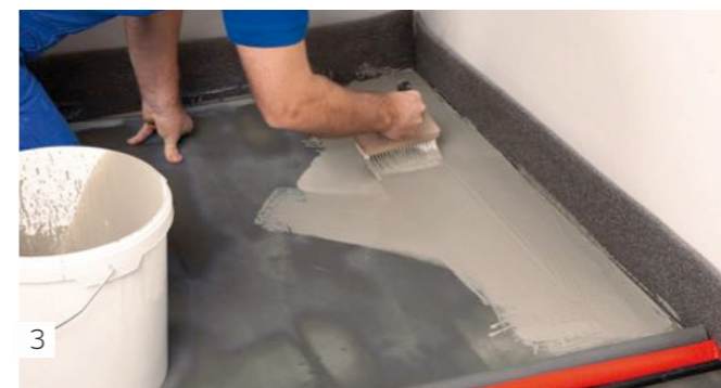
3 Application du pont d'adhérence délayé