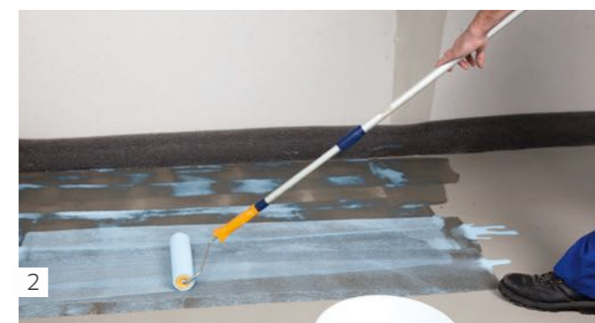
2 Couche de fond