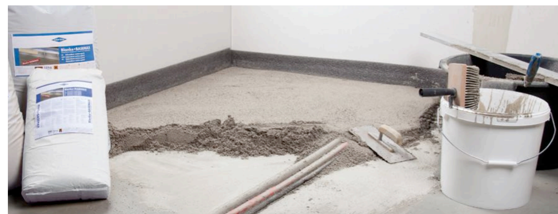
Incorporation sans problème des canalisations et des câbles

BLANKE BASEMAX se compose de matière de remplissage légère sous forme de granulés de verre soufflé et d'un liant à base de ciment. En mélangeant avec de l'eau, on obtient à partir des deux composants une égalisation légère liée avec le sous-sol inégal - peu importe qu'il s'agisse de béton, de chape, de parquet ou de plancher en bois - une compensation de 5 mm et même jusqu'à 100 mm est possible. BLANKE BASEMAX se caractérise par son grammage très faible qui représente environ 25 % seulement d'une chape traditionnelle comparable. BLANKE BASEMAX peut déjà être recouvert après 12 heures seulement et les systèmes de sol Blanke peuvent être collés et produits facilement et directement.