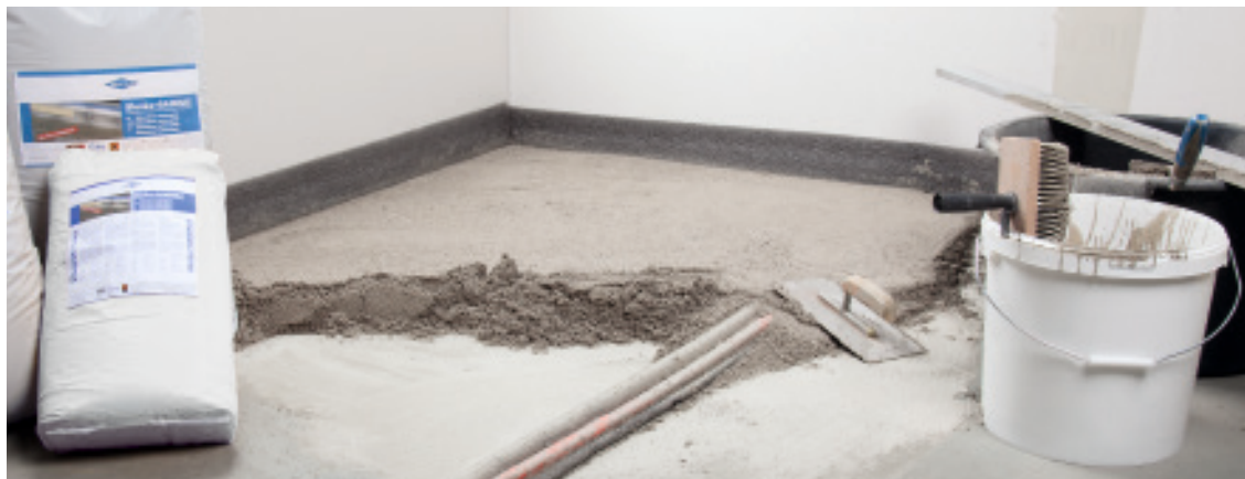
Problemlose Einarbeitung von Rohren und Kabeln

BLANKE BASEMAX besteht aus Leichtfüllstoff in Form von Blähglasgranulat und einem zementären Bindemittel. Mit Wasser gemischt entsteht aus den beiden Komponenten ein gebundener Leichtausgleich mit dem unebene Untergründe – egal ob Beton, Estrich, Spanplatten oder Holzdielen – von nur 5 mm bis sogar 100 mm ausgeglichen werden können. Dabei zeichnet sich BLANKE BASEMAX durch sein äußerst niedriges Flächengewicht aus, das 75% leichter als ein vergleichbarer herkömmlicher Estrich ist. Bereits nach 12 Stunden ist BLANKE BASEMAX verlegereif und die Blanke Bodensysteme können ohne weiteres direkt verklebt und aufgebaut werden.